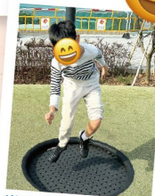
遊樂場旁邊的一個空間，有一個小彈床讓小朋友放鬆一下