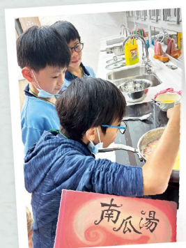
聽完《南瓜湯》之後，一齊煲碗南瓜湯先 😊