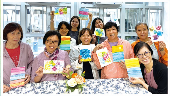
學習逆境感恩 分享生命故事