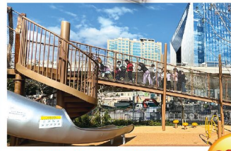
一班小朋友排隊上去玩滑梯