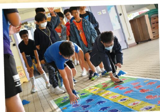
雙人合作同步同行