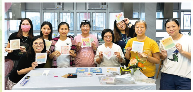
彼此相知 共同學習