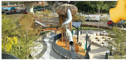
滑梯高兩層，小朋友要經過繩網陣的關卡才可到達最高點，然後穿過滑梯到達地面