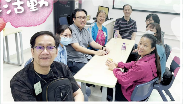
家長：「我願意陪伴你一起成長！」