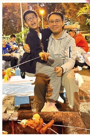
親子活動，重建親密關係