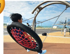
這一個特別的繩圈，小朋友可以用不同的方法去遊玩