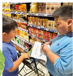
想清楚要甚麼東西... 🤔