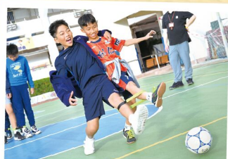
我數三聲一齊踢個波入龍門！