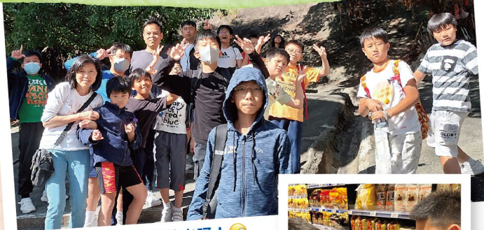
企好！唔好碌落山呀！🤩