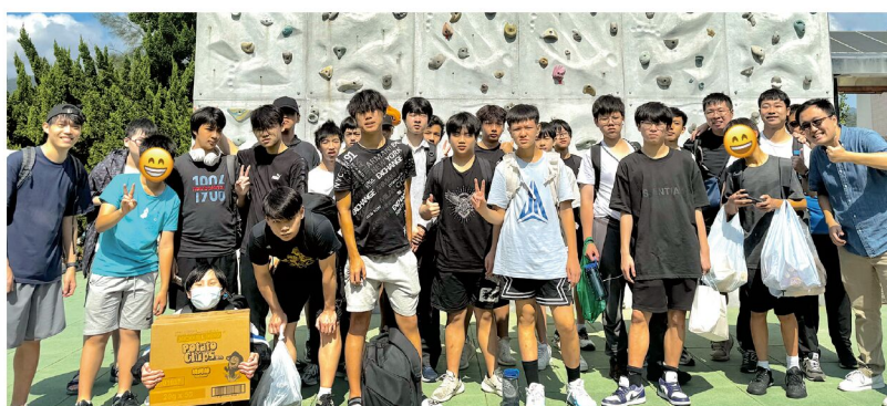
經過兩日一夜後的大合照 🤝