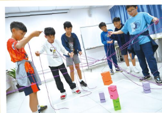
舍友溝通準確才能完成任務