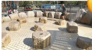
公園有一個玩水的位置，天氣熱可以讓小朋友玩水