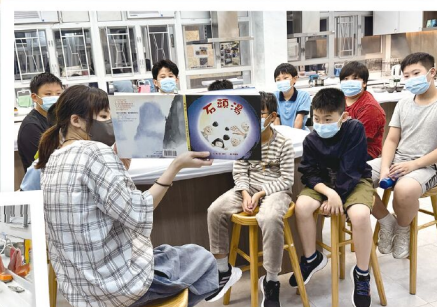
大家都聚精匯神聽故事