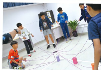
要成功將方盒勾起再疊高！