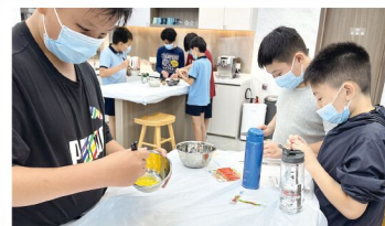
今次真係有得玩又有得食 😊