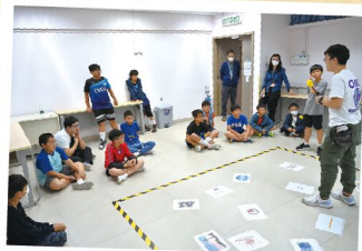
要先專心，聽清楚遊戲玩法