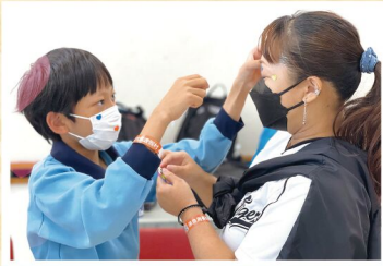
孩子入宿後， 舒緩緊張的親子關係