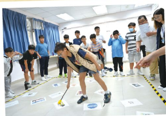
大家要齊心完成任務